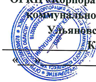
График испытаний трубопроводов тепловых сетей теплоисточников ПЭУ р. п. Ишеевка ОГКП «Корпорация развития коммунального комплекса Ульяновской области» в межотопительный период 2021 года.